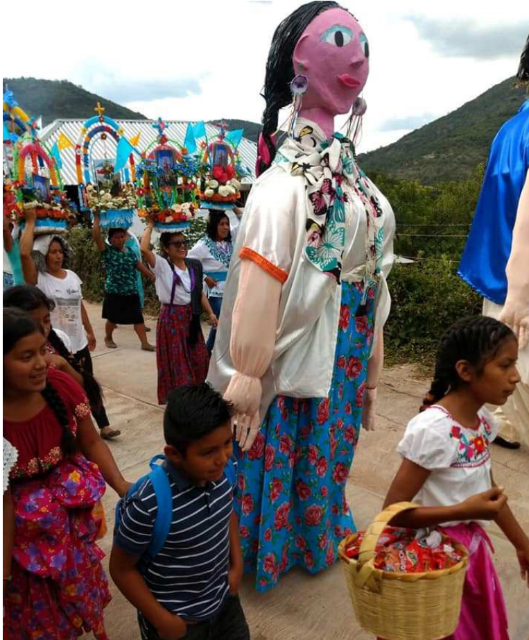
Foto 1. Convite de la Virgen de la Asunción, San Miguel Yogovana, Miahuatlán de Porfirio Díaz, Oaxaca, 13 de agosto de 2019. Los monos se realizaron con un grupo de niños zapotecas durante el taller de monos de calenda impartido por Griselda Coss, durante los meses de abril y julio de 2019, en la agencia San Miguel Yogovana, para ser bailados por ellos durante la fiesta patronal de la Virgen de la Asunción