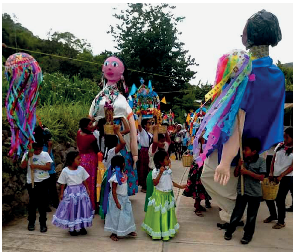
Foto 2. Convite de la Virgen de la Asunción, San Miguel Yogovana, Miahuatlán de Porfirio Díaz, Oaxaca, 13 de agosto de 2019

Los muñecos se apropian del espacio hegemónico con sus grandes dimensiones y siempre aparecen en la estampa turística oficial, y como “habitantes cotidianos” en el corazón de esta ciudad. Algunas veces como un signo de distinción, por lo que pueden llegar a representar un signo de identidad y de poder económico.